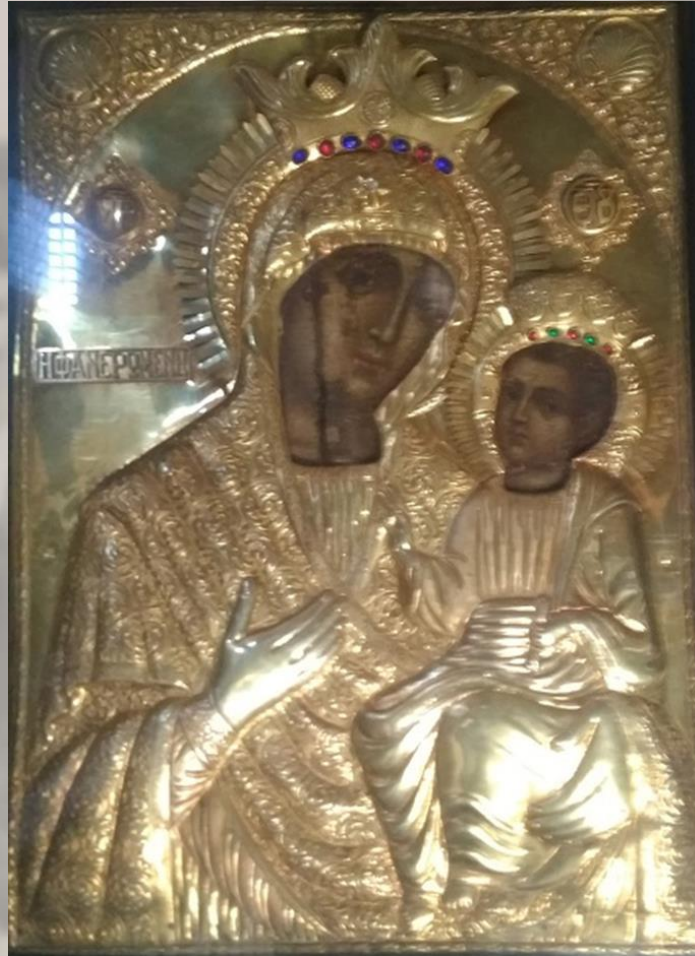
Εικόνα Παναγίας Φανερωμένης