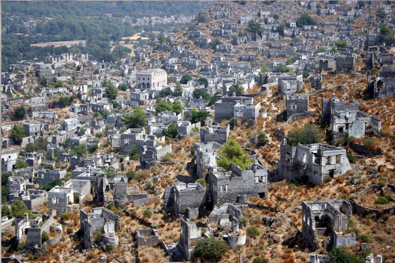
Το Λιβίσι Τώρα