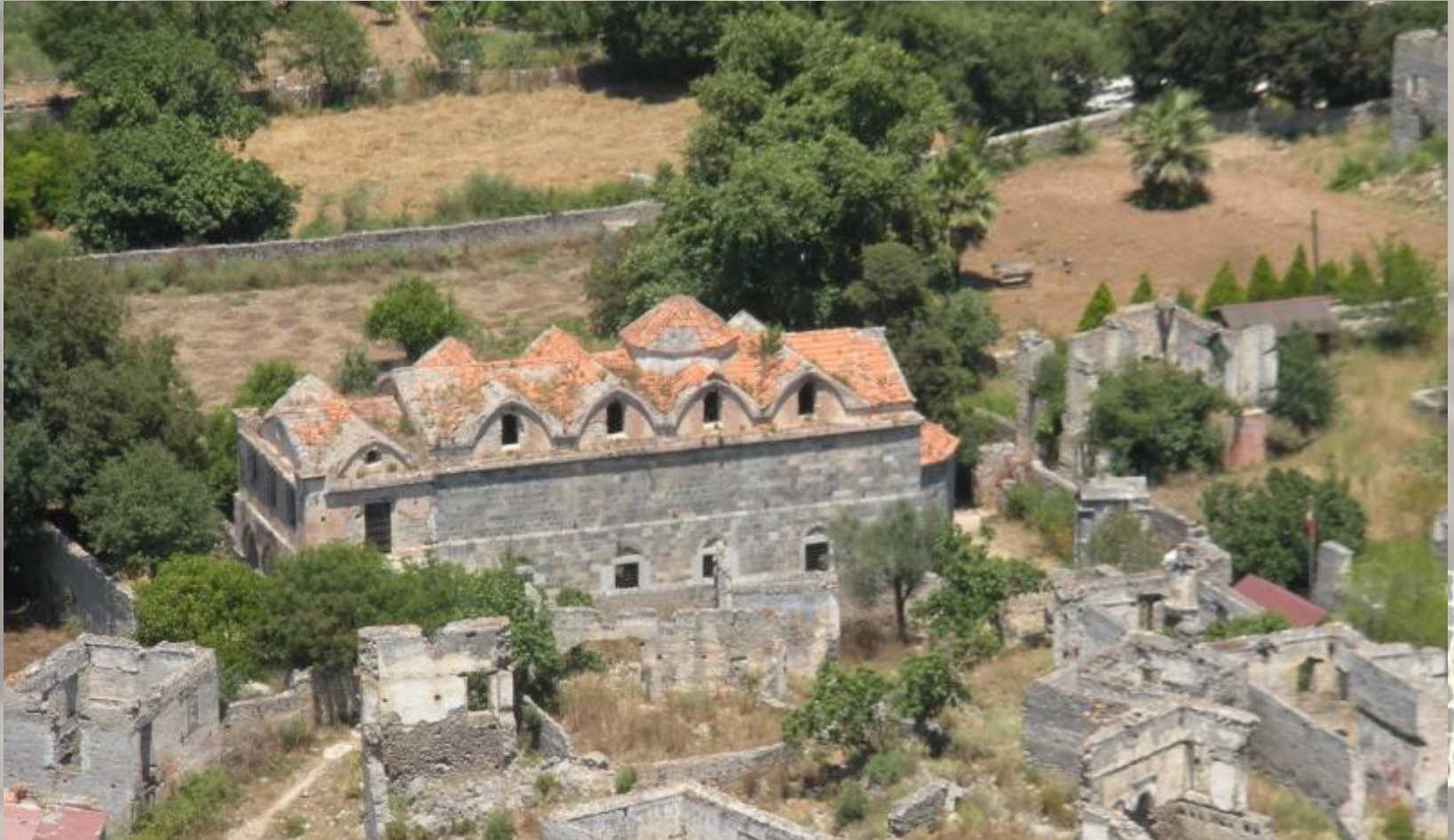
«ΕΛΠΙΝΙΚΗ» Παναγία Πυργώτισσα (Κάτω Παναγιά)