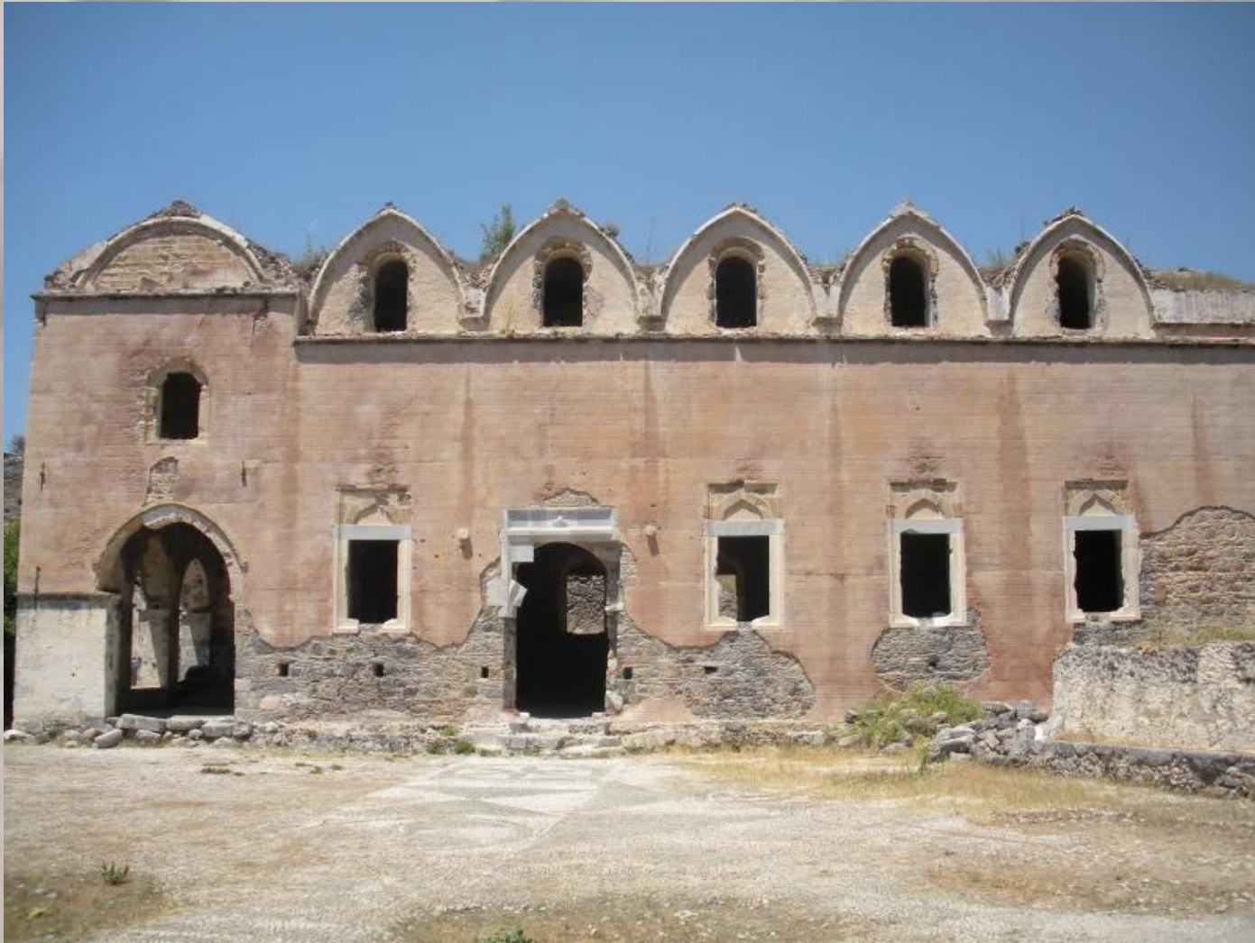
Ο Ταξιάρχης, με το βοτσαλωτό δάπεδο