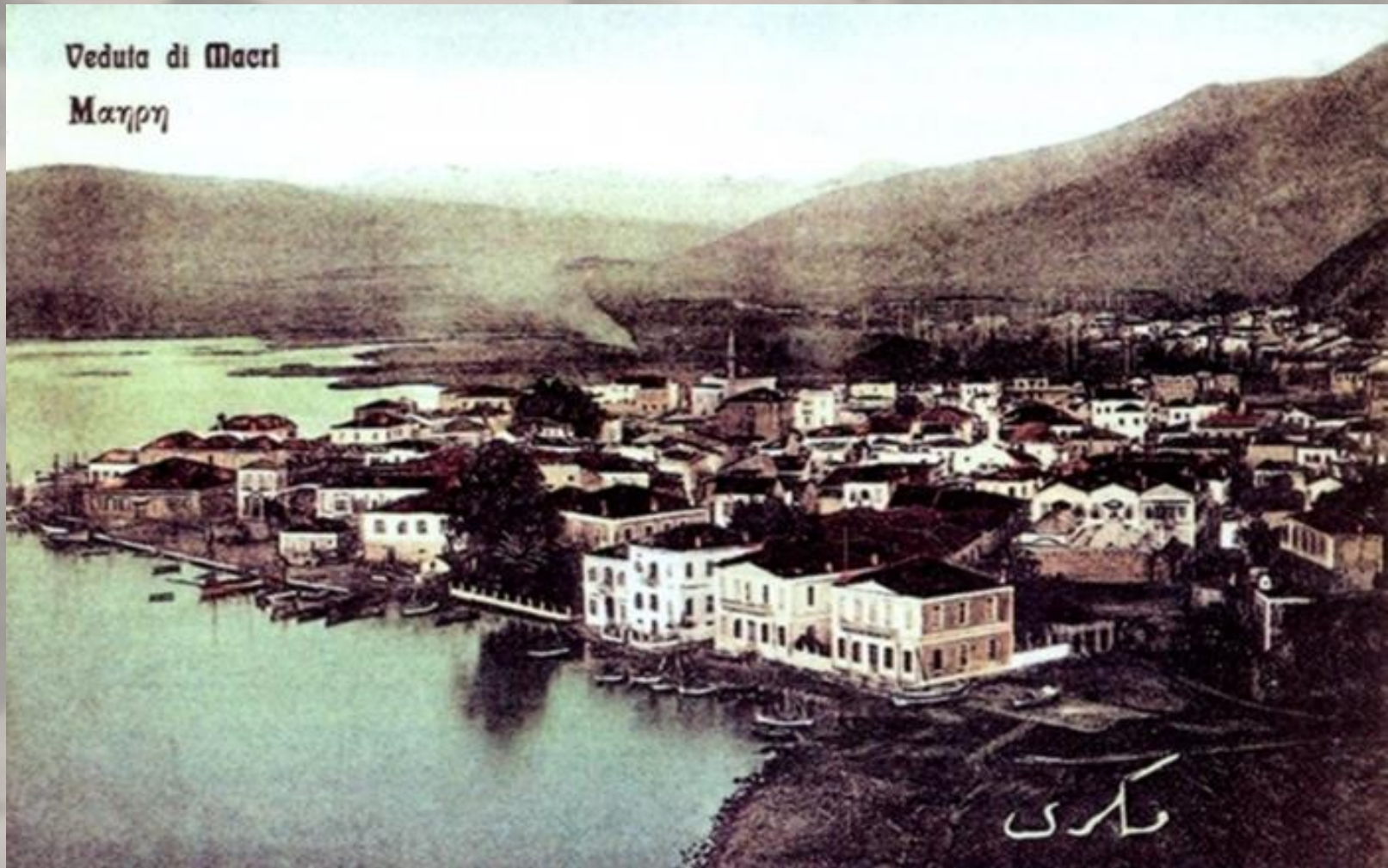
Η Μάκρη πριν την καταστροφή